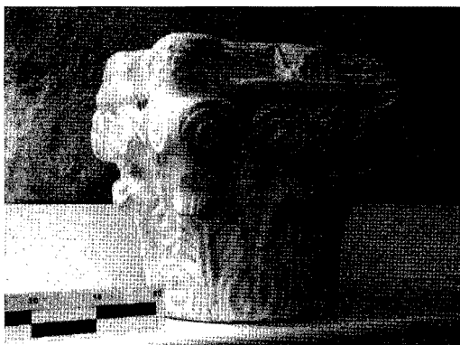
Lám. 7. Capitel romano. Museo Arqueológico y Etnológico de Granada.