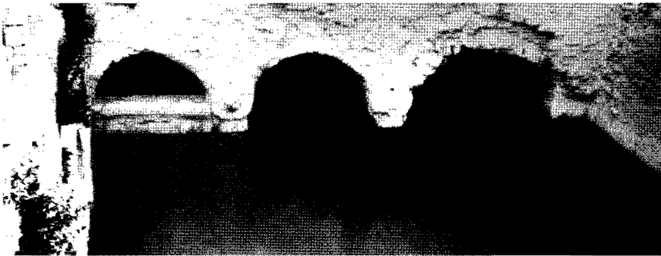
Lám. 1. Balneario de Zújar (1984). Zona suroeste de la piscina, con tres arcos sobre pilares (el de la izquierda, parcialmente tapiado).

Frente a la descripción de Sierra, sucinta en este punto, en este caso se incide en el aspecto de lo que denomina claustro, de forma cuadrada y con tres arcos por lado, enmarcando la piscina. Hasta su destrucción en 1985 quedaban en pie los tres arcos de uno de los lados (lám. 1; fig. 1, n.º 9).