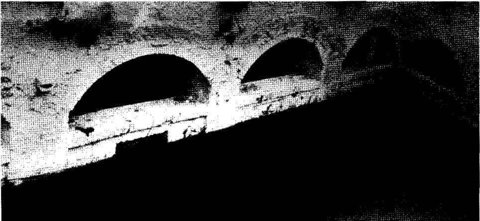
Lám. 2. Balneario de Zújar (1984). Zona sur de la piscina, con cuatro arcos soportados sobre pilares.

También se respetó en el lado contiguo izquierdo una estructura que presenta particularidades respecto del resto del conjunto (lám. 1). La forman tres arcos soportados en dos pilastras. El arco de más a la izquierda está parcialmente tapiado, mientras que los otros dos se sostienen en una pilastra más fina y descansando directamente en el propio suelo de la piscina (fig. 1, n.º 9). Por su parte la pilastra de la derecha parece reforzada con el añadido de la tapia que cierra esta parte.