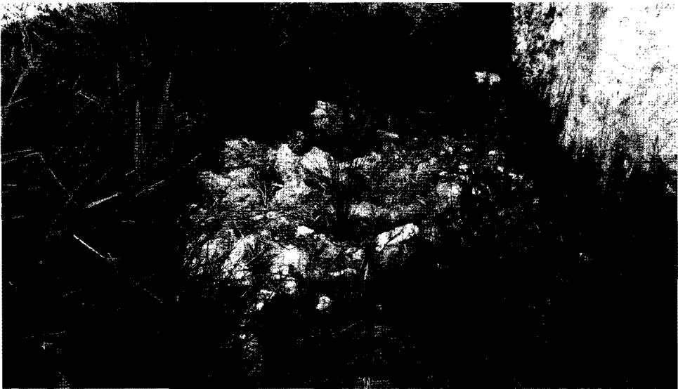
Lám. 5. Balneario de Alicún de las Torres (2014). Zona trasera del balneario actual, vista del detalle del suelo de la antigua piscina de pobres.