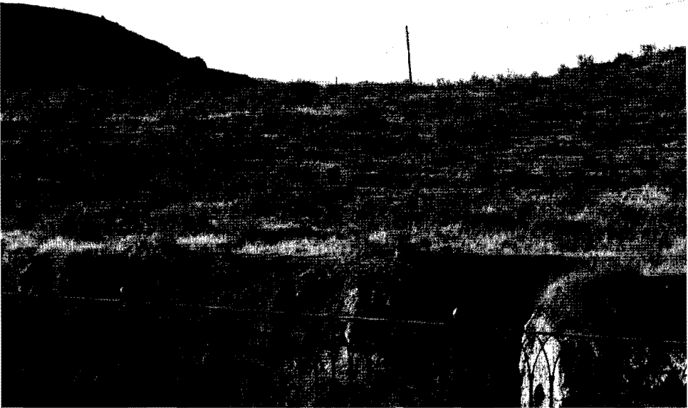
Lám. 6. Balneario de Alicún de las Torres (2014). Vista general del llano de la Ermita desde la trasera del terraplén de la ermita actual.

“En este yacimiento también se han podido documentar los restos arqueológicos procedentes de una villa romana, tanto estructuras, algunos muros y pavimentos, como material constructivo disperso en superficie (tégulas e ímbrices) y fragmentos cerámicos, donde destaca la cerámica de almacenamiento, fundamentalmente dolia.” 39