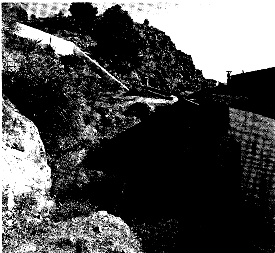
Lám. 4. Balneario de Alicún de las Torres (2014). Zona trasera del balneario actual, vista general.

El argumento que plantea, lógico e intuitivo sin duda, es que los pobladores de la zona, desde una época remota que denomina antediluviana, no pudieron dejar de usar aguas con unas características y una termalidad tan evidente, incluidos también los romanos.