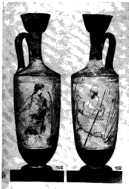
Fig. 4a.—La Habana, Musco de Bellas Artes (11). Antes de su deterioro. Foto de Mü Med 16, 1956 pl. 41.