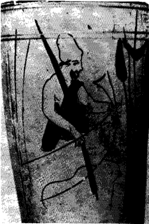
Fig. 6.—Providence, Rhode Island School of Design 25082 (17)