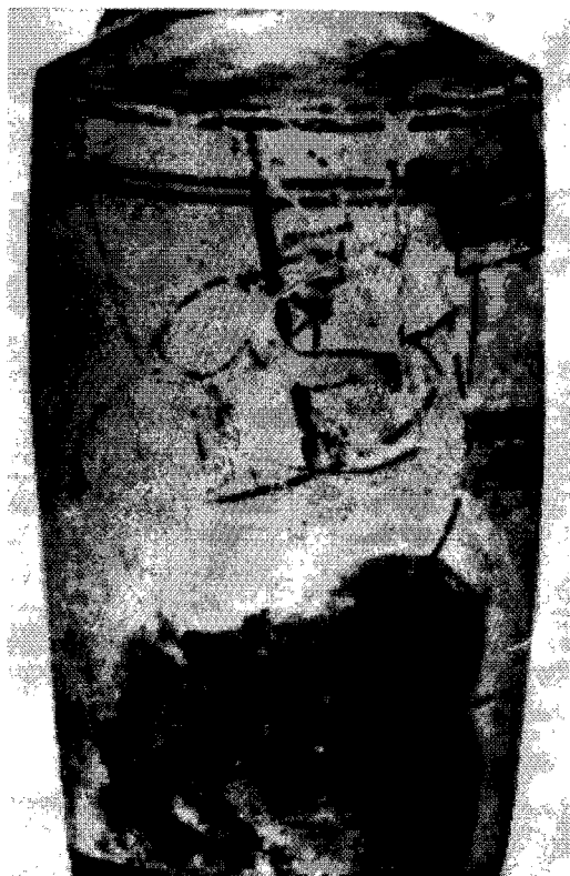
Fig. 3.—Copcnague MN 729 (9).

12. Hamburgo, Museum für Kunst und Gewerbe 1917.817 (ARV 1381,111; Para 486; Add 2 371) 15