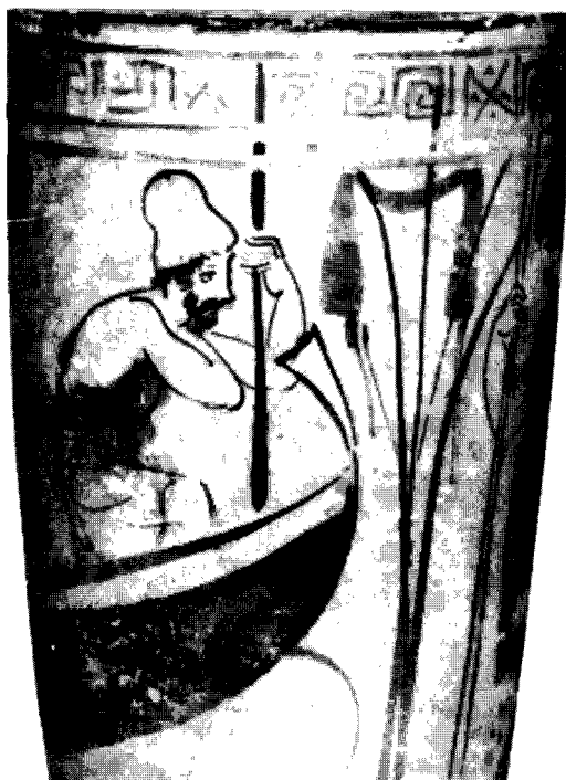
Fig. 2.—Colonia (8).