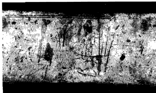
Fig. 5.—Paris, Louvre MNB 622 (15)

ellos pero por criterios de comparación tipológica parece probable su relación con el pintor que nos interesa 23 .