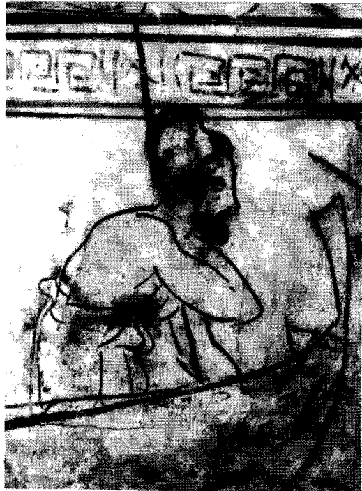
Fig. 1.—Atenas MN 1759 (2).